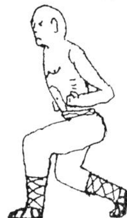
3. Tai Sam Gung Bo enger, geduckter Reitsitz