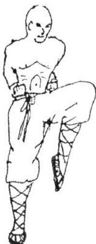
Tu Ma Stand auf einem Bein