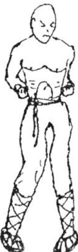
Yee Chi Kim Yeung Ma Knie „nach innen“ Stand