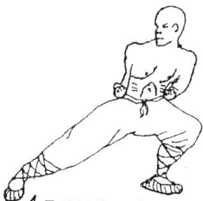
1. Tai Yat Gung Bo Flachhaltung