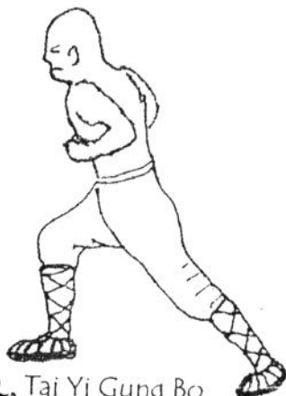
2. Tai Yi Gung Bo geduckter Reitsitz