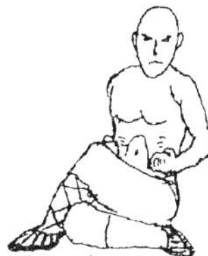
„sitzender“ Lau Ma Scherensitz