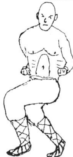
Lau Ma Scherenstand